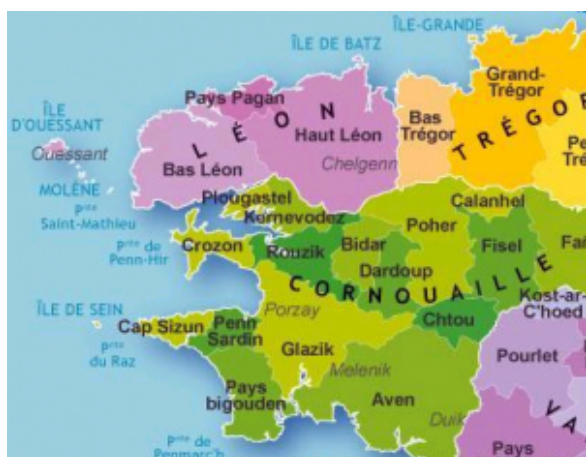
Carte de la Cornouaille bretonne

La Cornouaille bretonne recouvre la partie sud du Finistère. Sa capitale historique est Quimper. Beaucoup placent la ville d'Ys dans la baie de Douarnenez . D'autres vers les Îles des Glénans . Des plongeurs amateurs espèrent toujours retrouver un jour les vestiges de cette cité engloutie par les eaux.