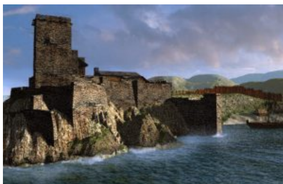
Illustration imaginaire de la ville d'YS

En Bretagne et en d'autres pays on se souvient de nombreuses villes de la côte englouties par les flots. Aucune de ces cités n'est aussi célèbre que la ville d'Ys .