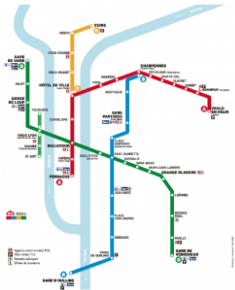
Métro de Lyon